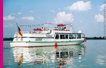
Altmühlsee - Fränk. Seenland